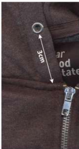
x2 Antic Alu metal eyelet (photo a)